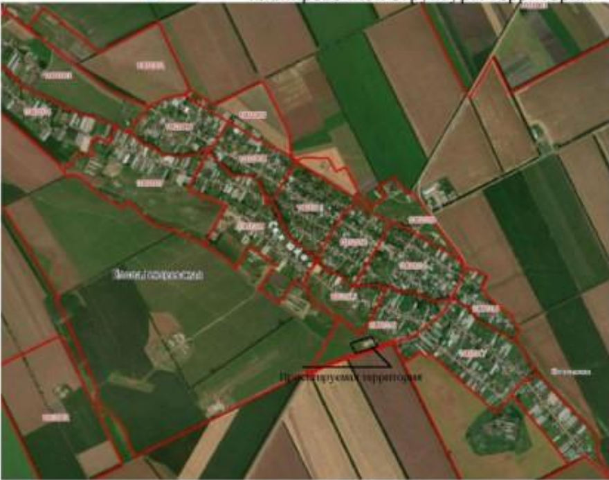
Схема расположения элемента планировочной структуры территории