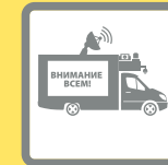
ПОДВИЖНЫЕ ЗВУКОУСИЛИТЕЛЬНЫЕ УСТАНОВКИ