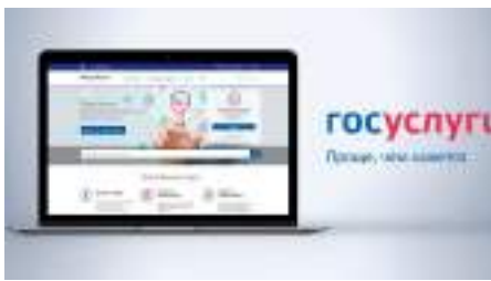
Единый портал государственных и муниципальных услуг