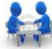
Личное обращение в ведомство